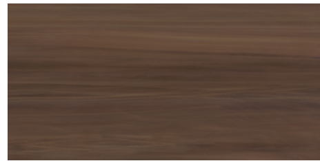
venus brown 30x60 rektyfikowana 5903943501847