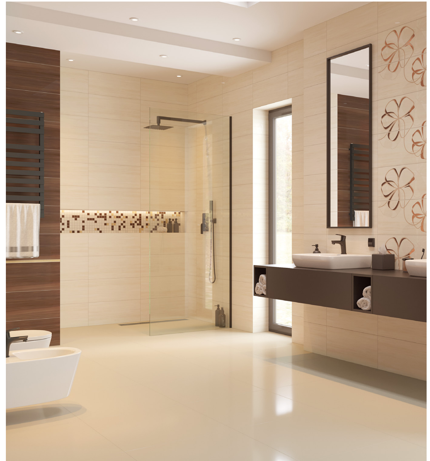
venus cream 30x60 /rektyfikowana/