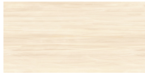
venus cream 30x60 rektyfikowana 5903943501823