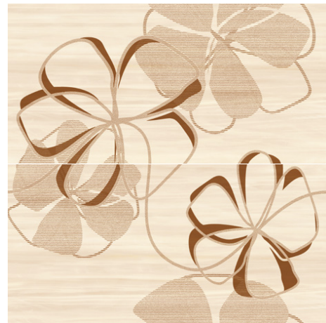
dekor venus cream 30x60 rektyfikowana 5903978236288