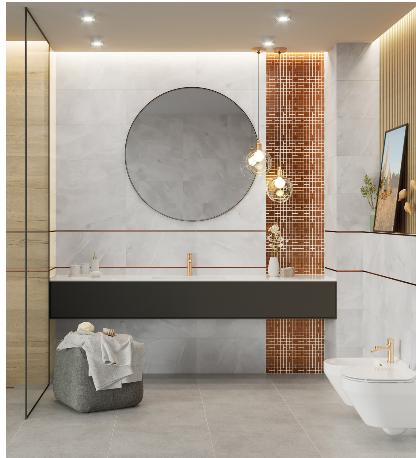
sergia 30x60 /rektyfikowana/