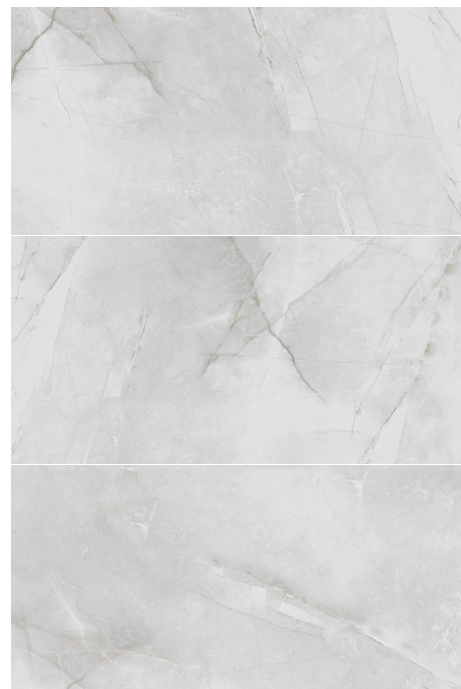
sergia grey 30x60 rektyfikowana 5903943500147 (CCR69)