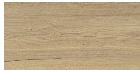
oak honey 30x60 rektyfikowana 503943501113 (CCR34)