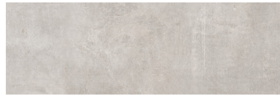
polaris dark 25x75 rektyfikowana 5902627432217