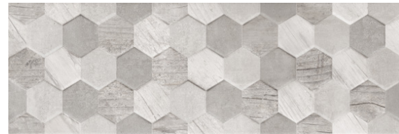
polaris hexagon mix 25x75 rektyfikowana 5902627432255