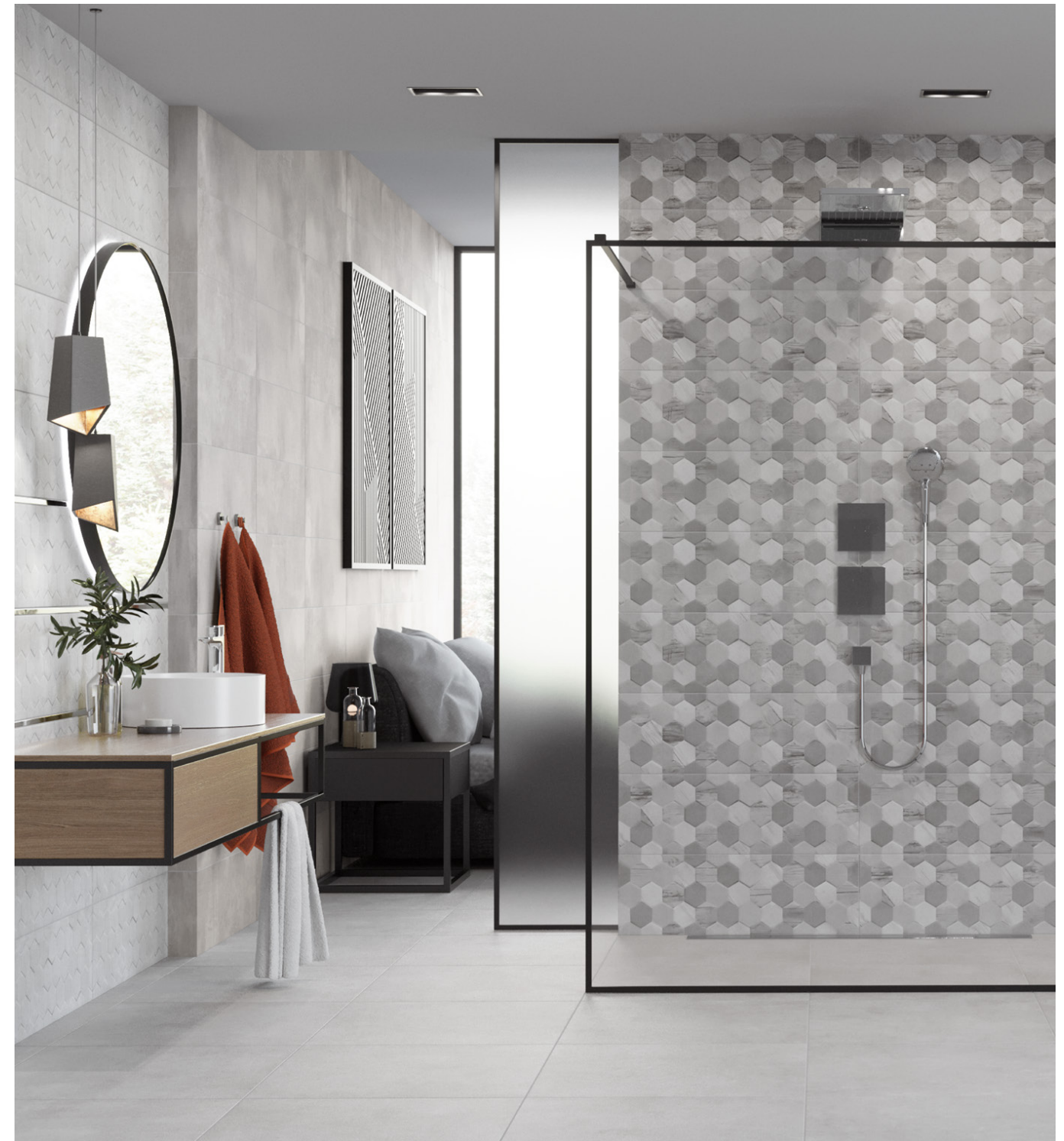
polaris 25x75 /rektyfikowana/