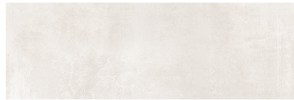
polaris light 25x75 rektyfikowana 5902627432200