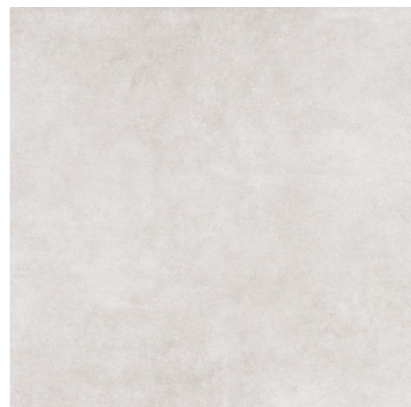
universal soft grey 60x60 rektyfikowana 5901503204917