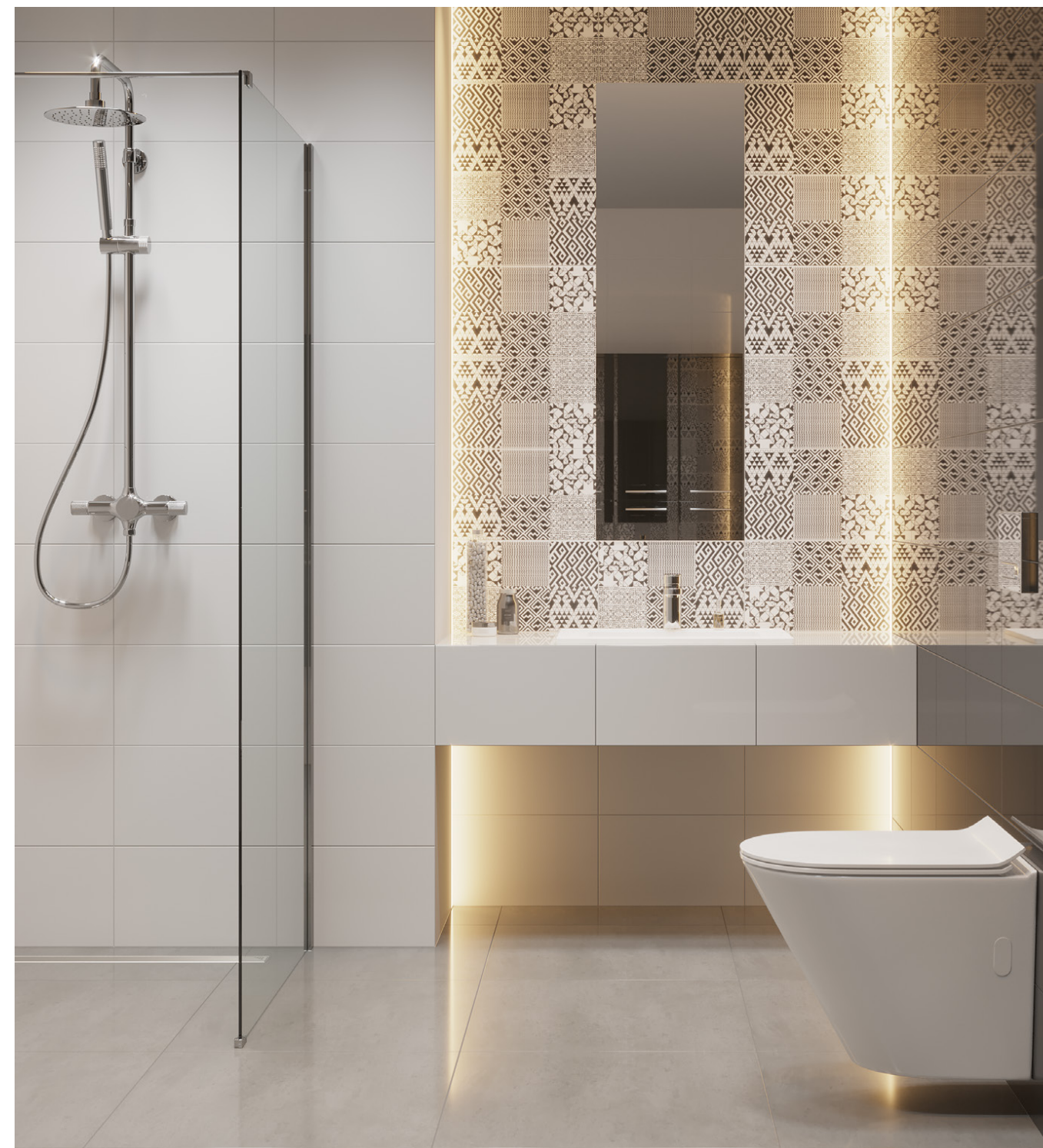
nero 25x40 /nierektyfikowana/