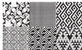
dekor nero majolika 25x40 ✎ ✎ 5900652639533