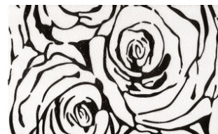
dekor rosa nero 25x40 ✎ ✎ 5900757032307